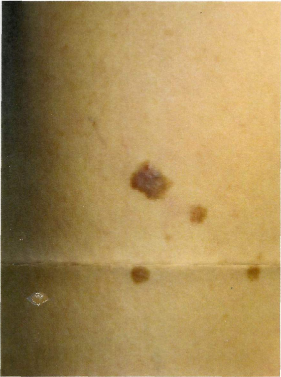
Uomo, 42 anni Visita nevi